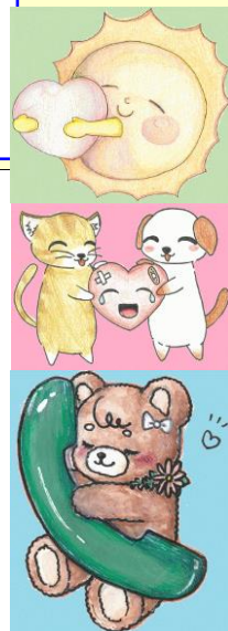
子ども相談支援センター イメージキャラクター